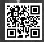
áudio de Filó, a Cozinheira de Afectos